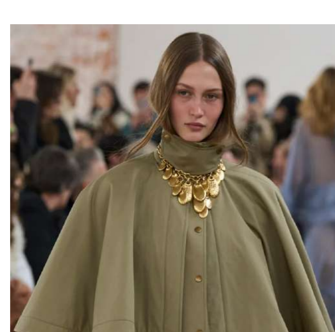
Fashion Paris Fashion Week: 5 Dinge, die uns aufgefallen sind von Mariella Ingrassia