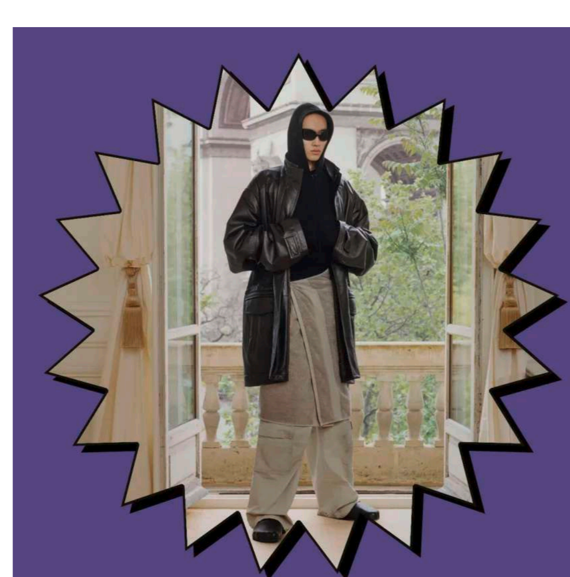
Fashion Fashion Find: Der Towel Rock von Balenciaga ist nicht so absurd wie ihr denkt von Leandra Nef