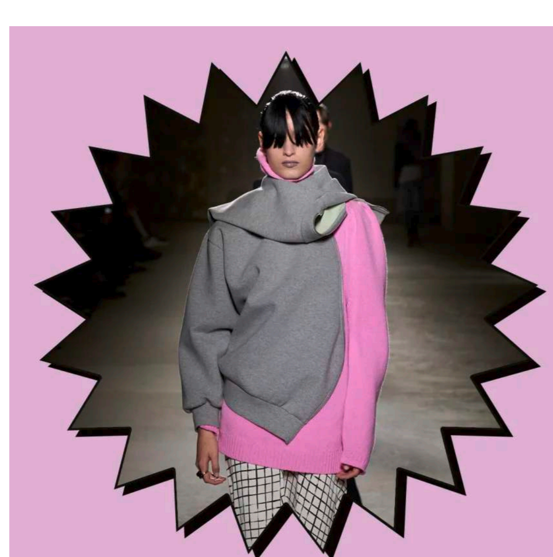
Fashion Fashion Find: Warum es jetzt cool ist, alles möglichst schief anzuziehen von Linda Leitner