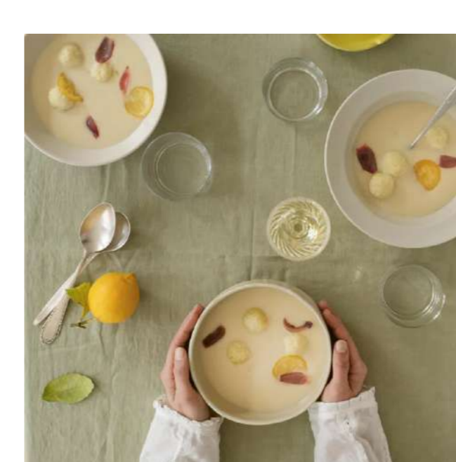
Food «Suppenkult»: 2 Suppen-Rezepte fürs ganze Jahr von Evelyn Emmisberger