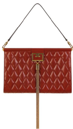
Tasche «Gem» (ab 1690 €), von Givenchy.