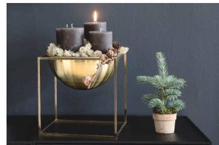
«Kubus Bowl» (zirka 430 Fr.), von By Lassen Copenhagen.