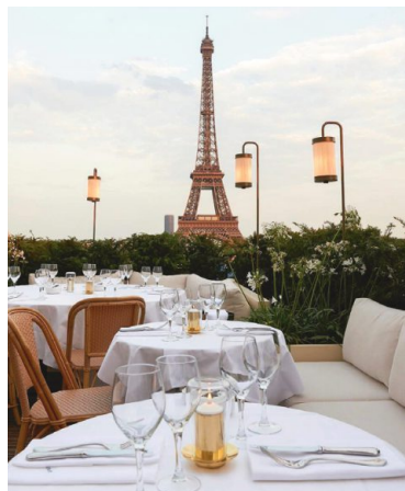
Ganz nett: Blick von der Terrasse.