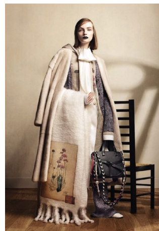
Jacke, Tasche und Decke aus der «Mackintosh x Loewe»-Kollektion.