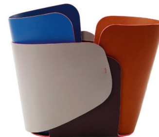
«Overlay Bowl», von Patricia Urquiola für Louis Vuitton.