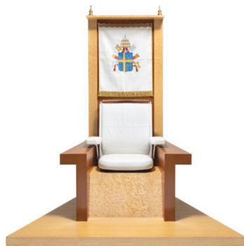
Papstthron, entworfen von Robert Somek, 1994.

Vitra-Design-Museum, Weil am Rhein, bis 17. Februar 2019