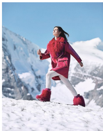
«Armani Neve» bietet Outfits für die Piste und das Après-Ski.

Das italienische Luxusmodehaus Giorgio Armani präsentiert mit «Armani Neve» (Schnee) eine Kollektion, die sich an Wintersporttreibende richtet. Spannend sind die verwendeten Materialien: Neben Outdoor-Bekleidung aus Samt überraschen leichte Jacken, die mit wärmenden Cashmere-Flocken gefüllt sind. Ausser den funktionalen Teilen gibt es eine grosse Auswahl an Après-Ski-Mode. Die Kollektion ist hauptsächlich in dunklen Tönen gehalten, akzentuiert mit Rot, Weiss und Fuchsia. (rud.)