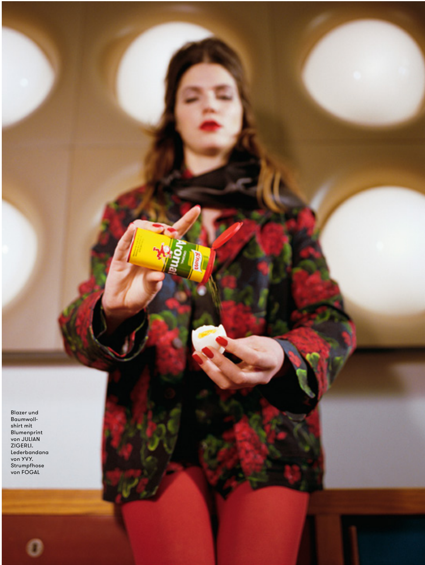
Blazer und Baumwoll-shirt mit Blumenprint von JULIAN ZIGERLI. Lederbandana von YVY. Strumpfhose von FOGAL