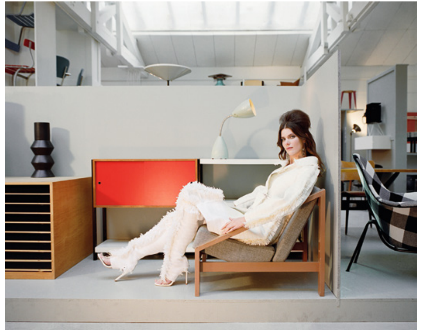
Mantelkleid und Stiefel aus gewebtem Bast von AMORPHOSE