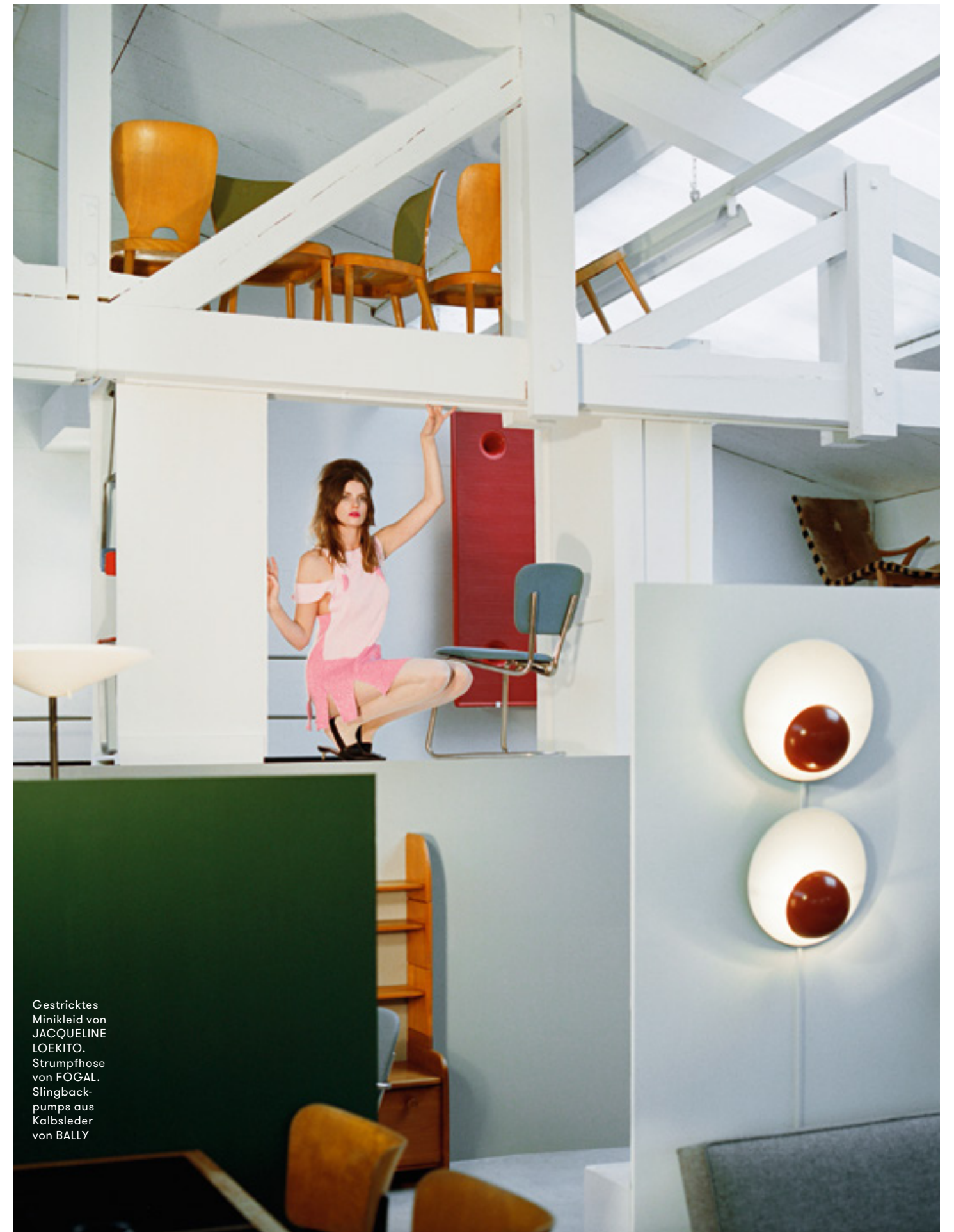
Gestricktes Minikleid von JACQUELINE LOEKITO. Strumpfhose von FOGAL. Slingback- pumps aus Kalbsleder von BALLY