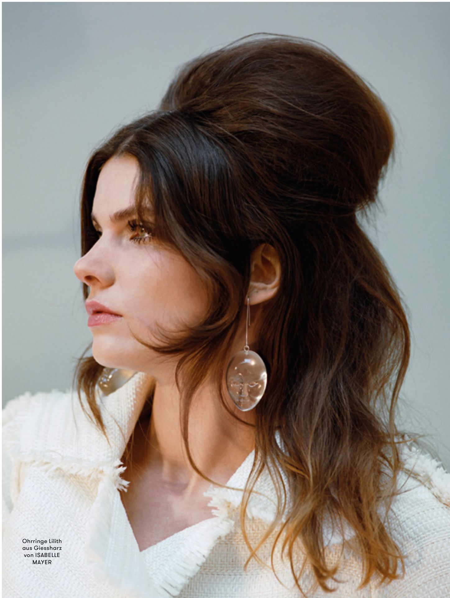
Ohringe Lilith aus Gießharz von ISABELLE MAYER