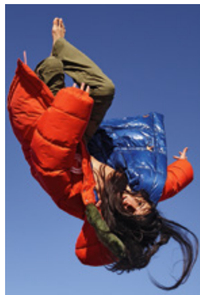
Illustration: Babeth Lafon