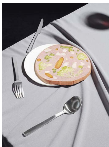
Carolien Niebling, «Mortadella with Vegetables», 2017.