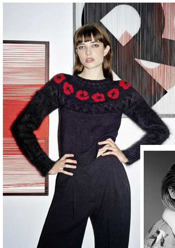
Schauspielerin Kirsten Dunst (unten) und ihr Design (links), bei Tasoni, Fr. 910.–.