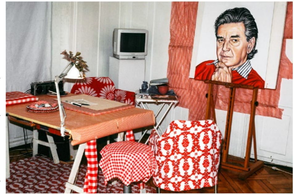
WALTER PFEIFFER «Untitled», 1995.

Vor zwei, drei Jahren zum letzten Mal. Jetzt habe ich wirklich genug davon. Es war meist schlimm für mich. Ich habe immer die Schönen, die Falschen erwischt, also die Heterosexuellen. Ich brauchte ein Ventil für all den Frust, und das fand ich in der Fotografie. Es hat mir gutgetan, die «Bubis» zu porträtieren, ihre Schönheit einzufangen. Die wussten nämlich gar nicht, wie schön sie sind. Heute weiss das jeder, und alle sind es sich wegen der iPhones gewohnt, ständig fotografiert zu werden. Wie findest du iPhone-Fotos? Meine werden immer schrecklich.