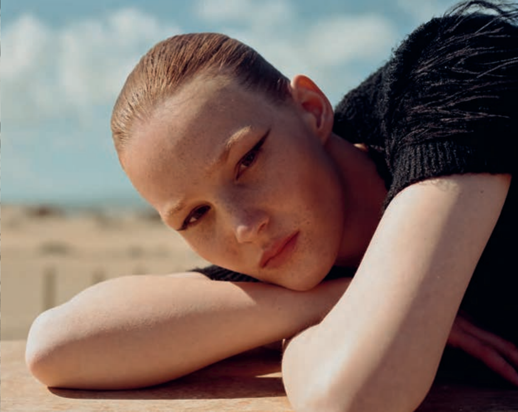
Geknüpftes Top aus Leder von YVY. Bluse vintage von JIL SANDER bei Maroni Vintage. Caprihose aus Seide von HOME OF HAI. Mules von FERRAGAMO